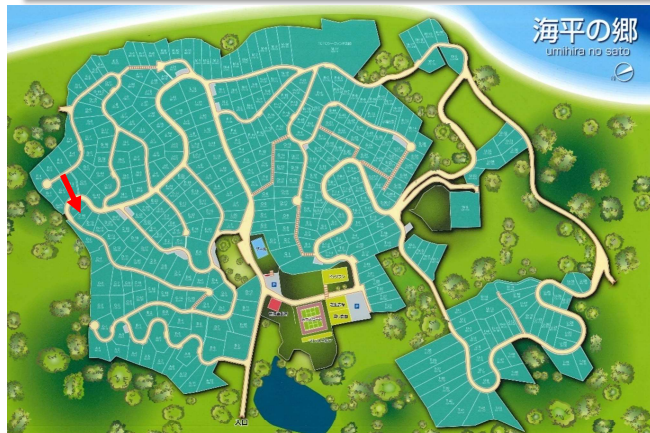
海平の郷 uminira no sato