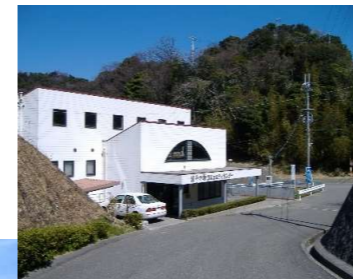
管理事務所 卓球場・シャワー室