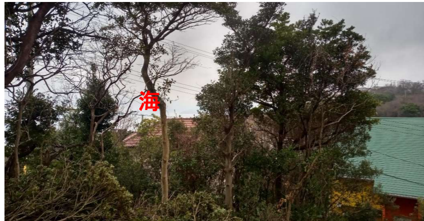
建物の配置により海の眺望が期待できます。