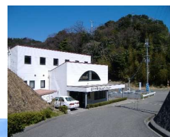
管理事務所 卓球場・シャワー室